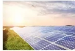
Energy Storage System