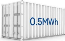
Standard 20ft containers