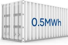
Standard 20ft containers