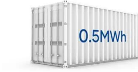
Standard 20ft containers