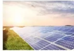
Energy Storage System