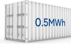
Standard 20ft containers